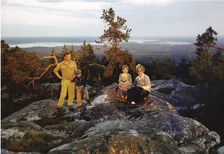
Lampelan perhe Vuokatinvaaralla vuonna 1973

minen seurustelutapana oli suosittua, ei ainoastaan linnanväen ja säätyläisten keskuudessa, vaan myös rahvaan ja porvariston tapoihin kuuluvana.