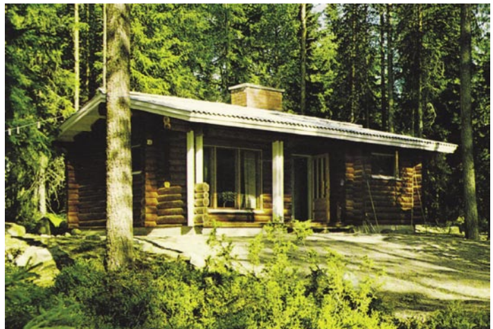
Idyllinen lomamökki Vuokatin Hiekkaniemessä

Tämän päivän jättikaivoksen, Talvivaaran, alkuhistoriakin ulottuu 1700-luvun lopulle. Silloin